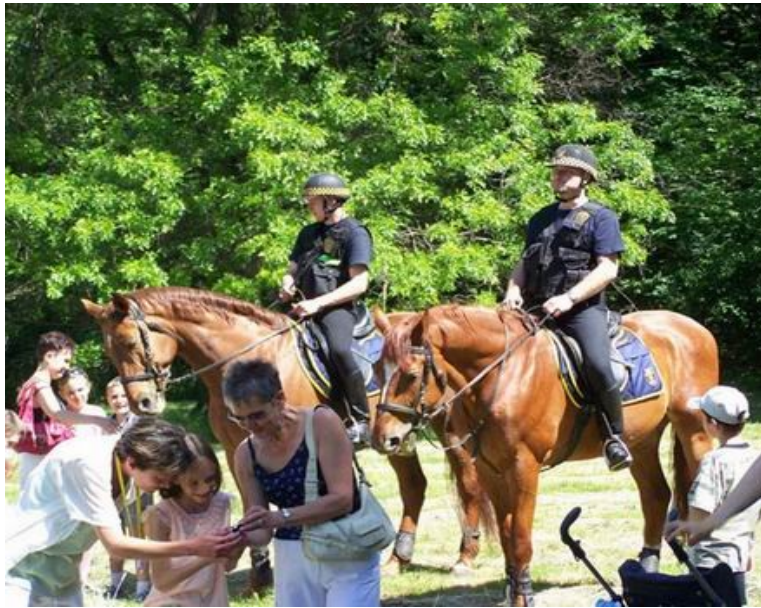
Міська сторожа м. Лодзі на конях

Від кількох місяців біля Асоціації діє танцювальний ансамбль Trinity Jump. Він виступив у День Дитини та свято врожаю у гміні Гошанув (сіерадзкий повіт), у яких брали участь офіційна делегація та волонтери нашої Асоціації.