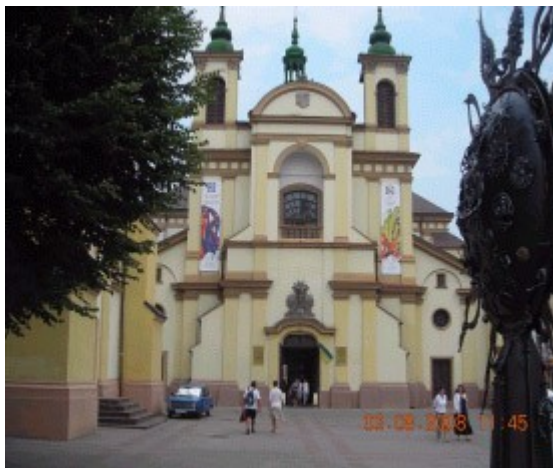
Івано-Франківськ у країнах регіону Східньої Європи

Асоціація Ініціатива РП, віруючи у власні перспективи розвитку у сфері закордонного співробітництва, почала дії спрямовані на нові зв'язки у Східній Європі. Плоди цих дій – це підписання ДЕКЛІРАЦІЇ ПРО СПІВРОБІТНИЦТВО з ЄВРОПЕЙСЬКИМ КЛУБОМ м. СТАНІСЛАВОВА Україна м. ІВАНО-ФРАНКІВСЬК.