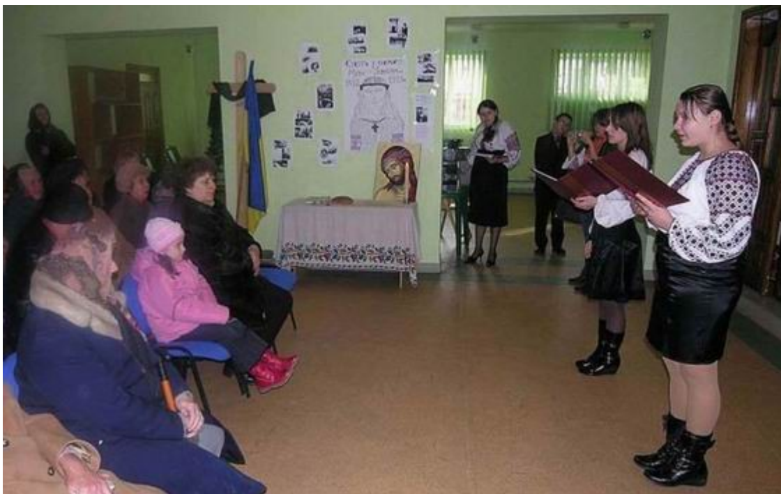
Центр европейских встреч в Ивано-Франкивске – Великий голод Постановка – актеры и молодежь