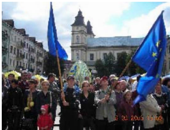
Сентябрь 2008 года — Ивано-Франкивск

Разве мы не слеплены из одной и той же глины? Мы тоже подобным образом оказывали радость в 2004 году, когда присоединились к Европейскому союзу.