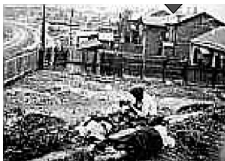
Настоящая фотография с тех годов.

Великий голод (Голодомор) – голод 1932-1933 г.г. во время коллективизации СССР был особенно трагическим на территории Украинской ССР (согласно различным данным голодомор унёс жизни 3,5-7 млн. человек). Власти Киева обращаются к ООН и Евросоюзу с просьбой признать Великий голод геноцидом украинского народа. До недавнего времени это признали некоторые европейские страны, в том числе и Польша. Против этого выступает Россия.